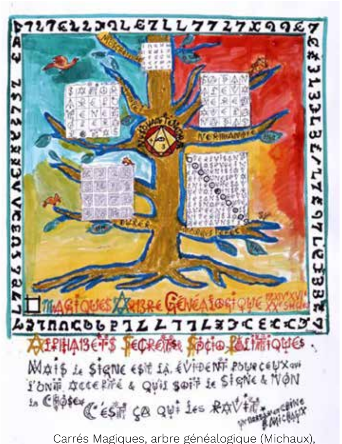
Carrés Magiques, arbre généalogique (Michaux), Jacques Villeglé, 2009