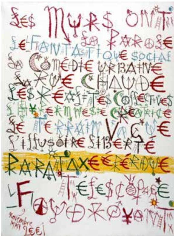
Les Murs ont la parole, Jacques Villeglé, 2001