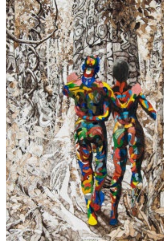
«Couple Businengue», 2012