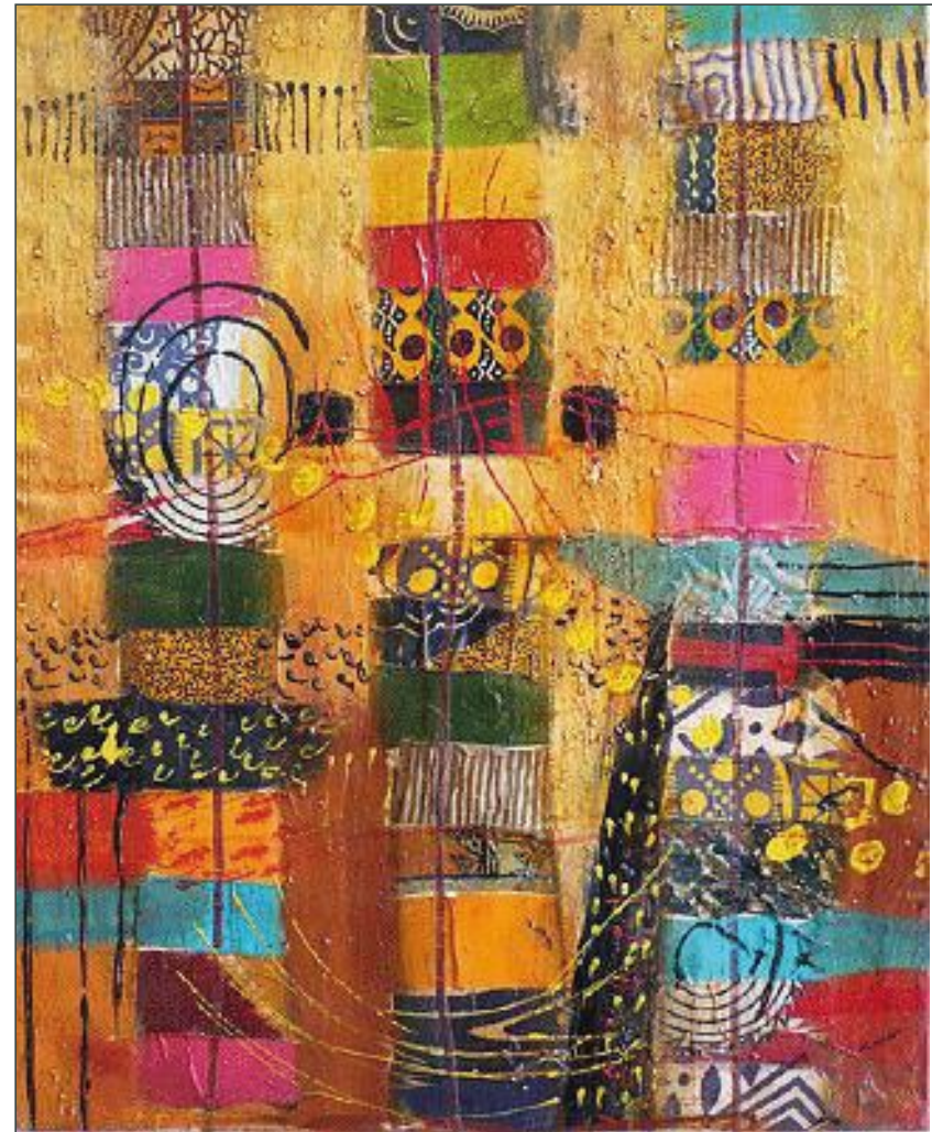
Sans titre, 2012