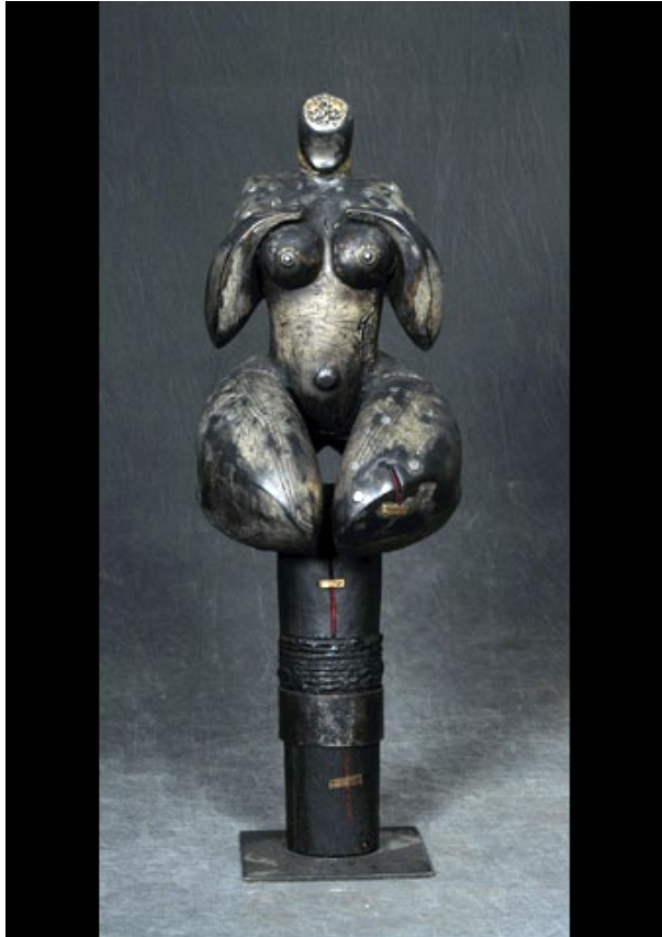
Love on the beat II, 2016