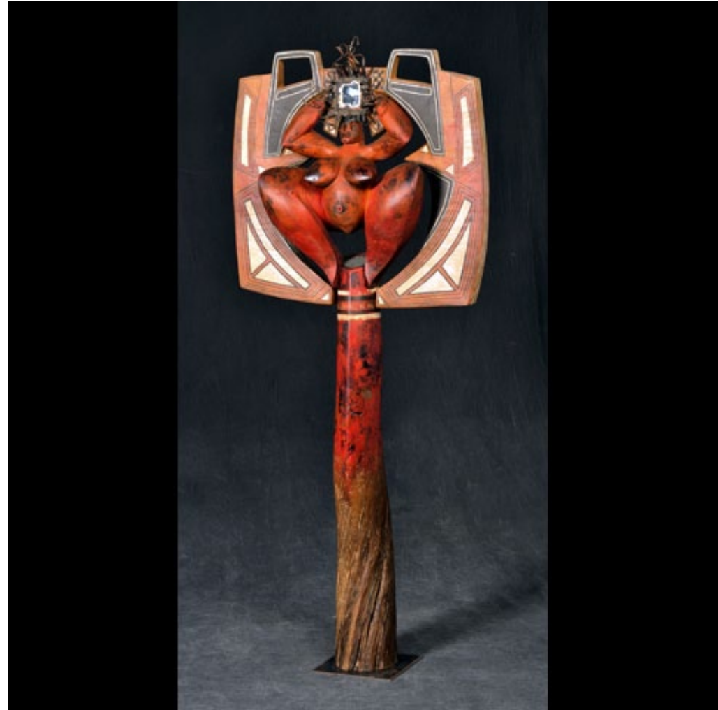
Dona nobil, 2015