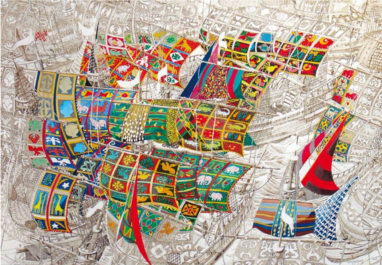
«Les Portes du Retour», 2013