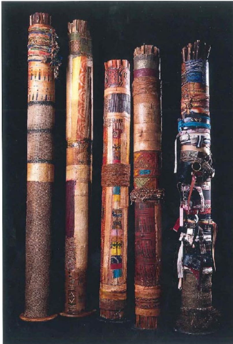
Fagots en force d'unité, 2006