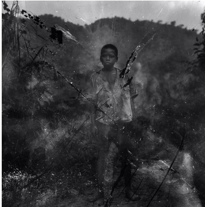
Jeune pygmée, Ouganda, 1996 - Louis Jammes