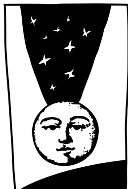
la lune en parachute art contemporain